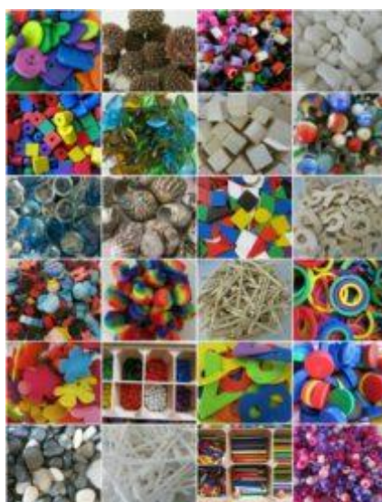
Using loose parts for play

Можно включать такие мелочи в любую сюжетную игру, игру с кубиками — это один из самых «открытых» материалов, и возможности для его творческого использования огромны!